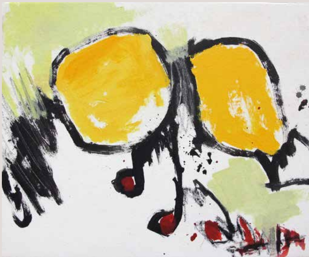
Horas infinitas , 2014, Técnica mixta sobre tela. 38 x 46 cm