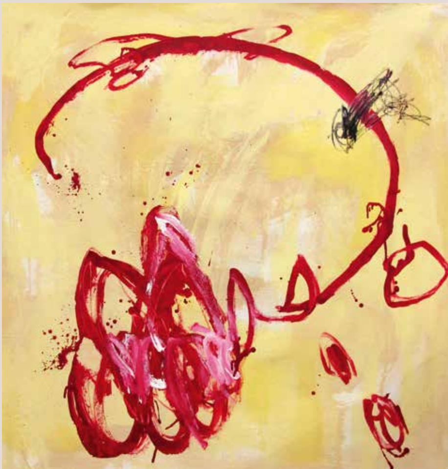
Imaginant , 2014, T cnica mixta sobre tela. 100 x 100 cm