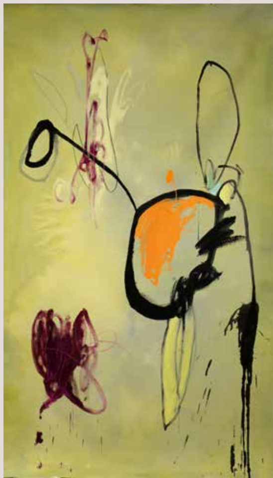
Calor de verano , 2015, Mixta sobre tela. 226 x 132 cm