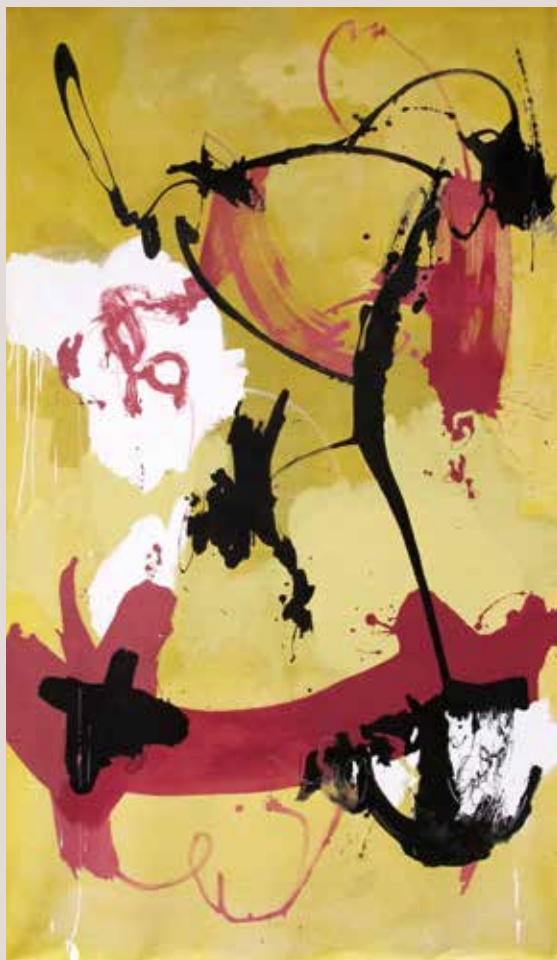
Bouganvillea salvage , 2015, Mixta sobre tela. 226 x 132 cm