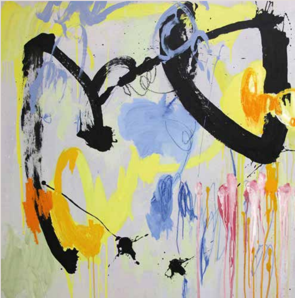
Canal Saint Martin , 2014, Técnica mixta sobre tela. 100 x 100 cm