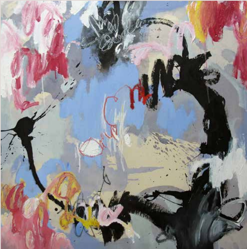
Place Larue , 2014, Técnica mixta sobre tela. 100 x 100 cm