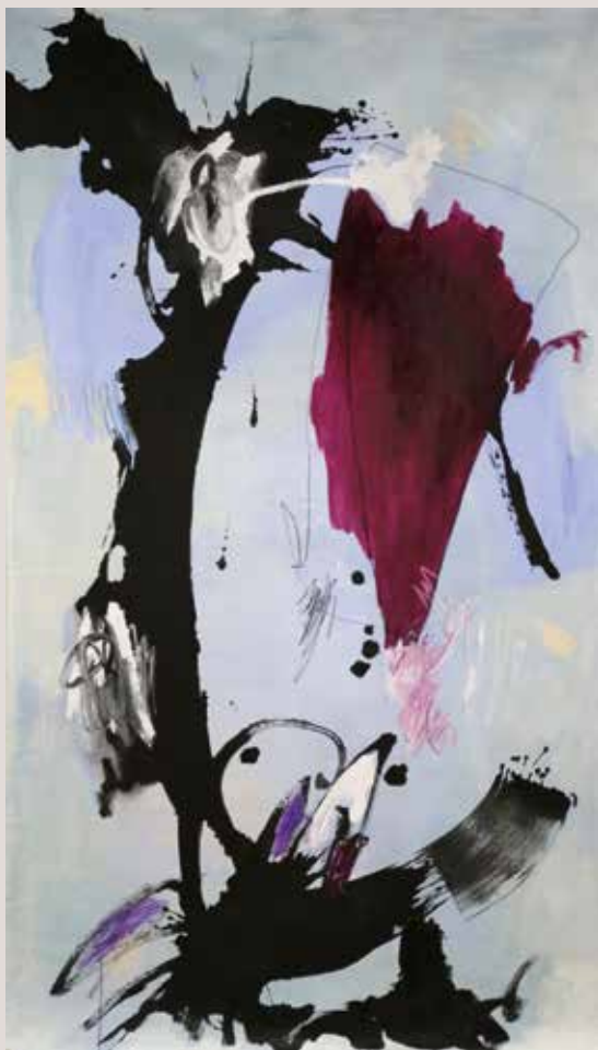
Música i ones , 2015, Mixta sobre tela. 226 x 132 cm