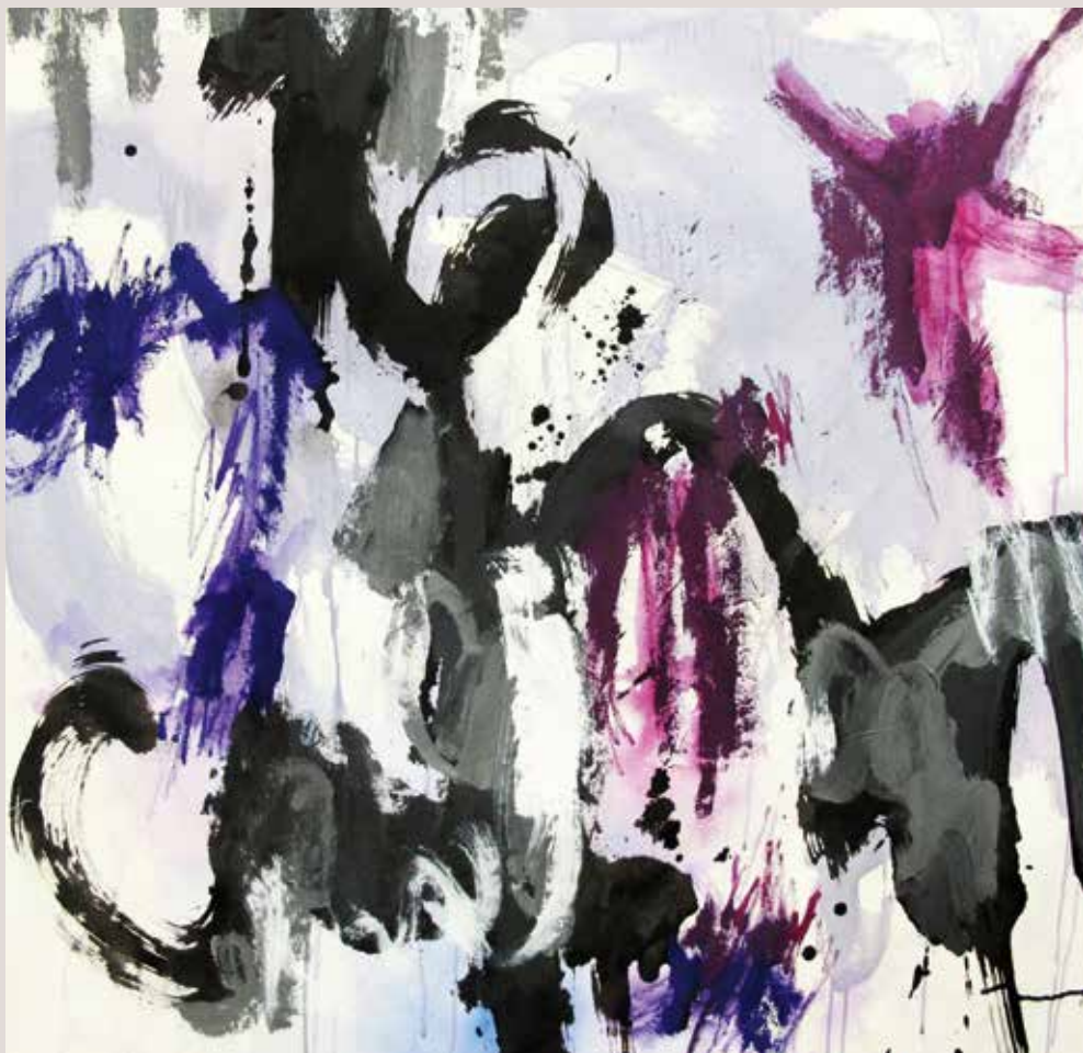
Aires nuevos , 2014, Técnica mixta sobre tela. 100 x 100 cm