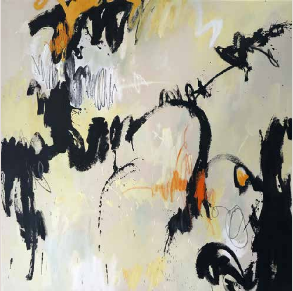
Camino indefnido , 2014, Técnica mixta sobre tela. 150 x 150 cm