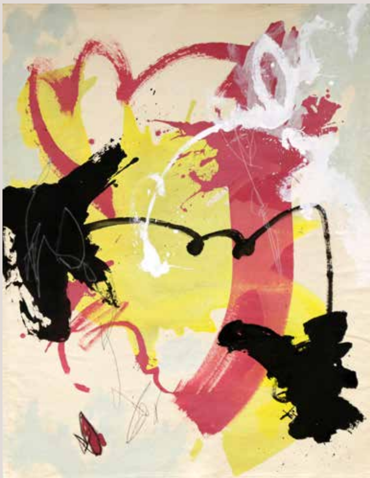
Amb els peus en terra , 2015, Mixta sobre tela. 100 x 81 cm