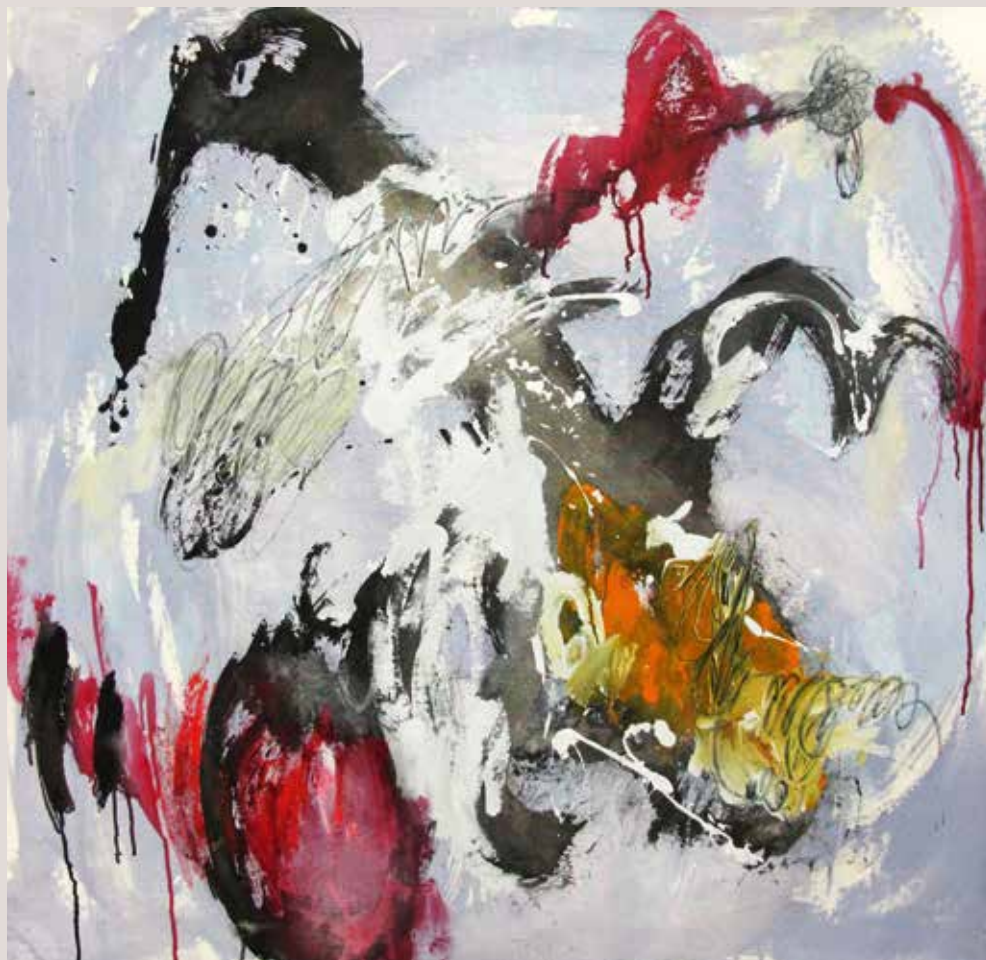
Au bord de la Seine , 2014, Técnica mixta sobre tela. 100 x 100 cm