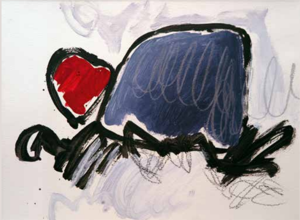
Dans la nuit , 2014, Técnica mixta sobre papel. 30 x 40 cm