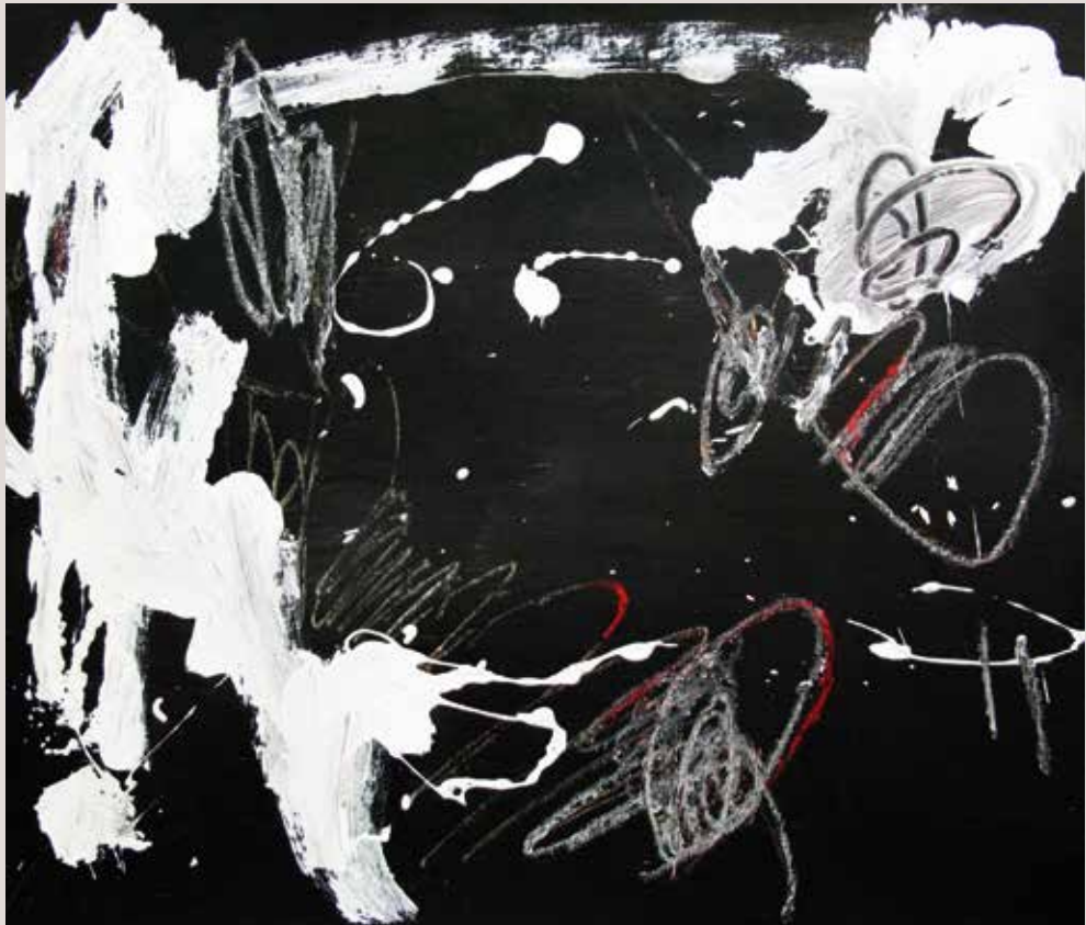
Sense por , 2014, Técnica mixta sobre tela. 38 x 46 cm