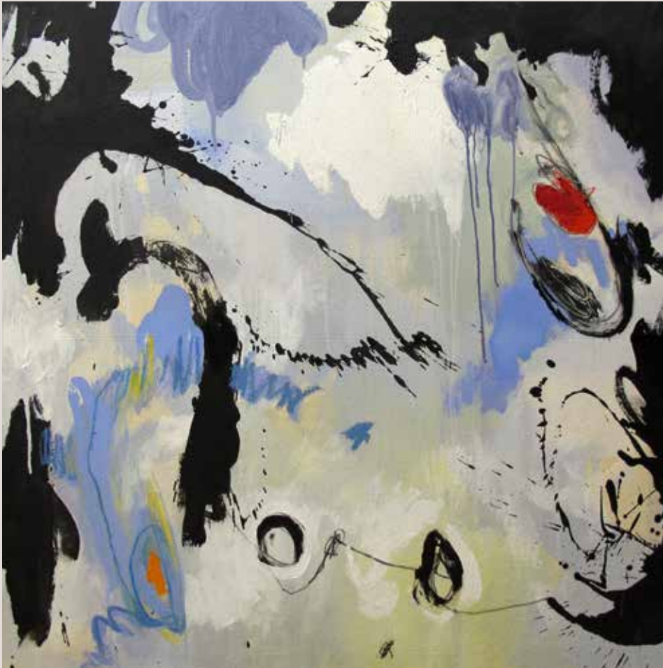
El enigma del camino , 2014, Técnica mixta sobre tela. 100 x 100 cm