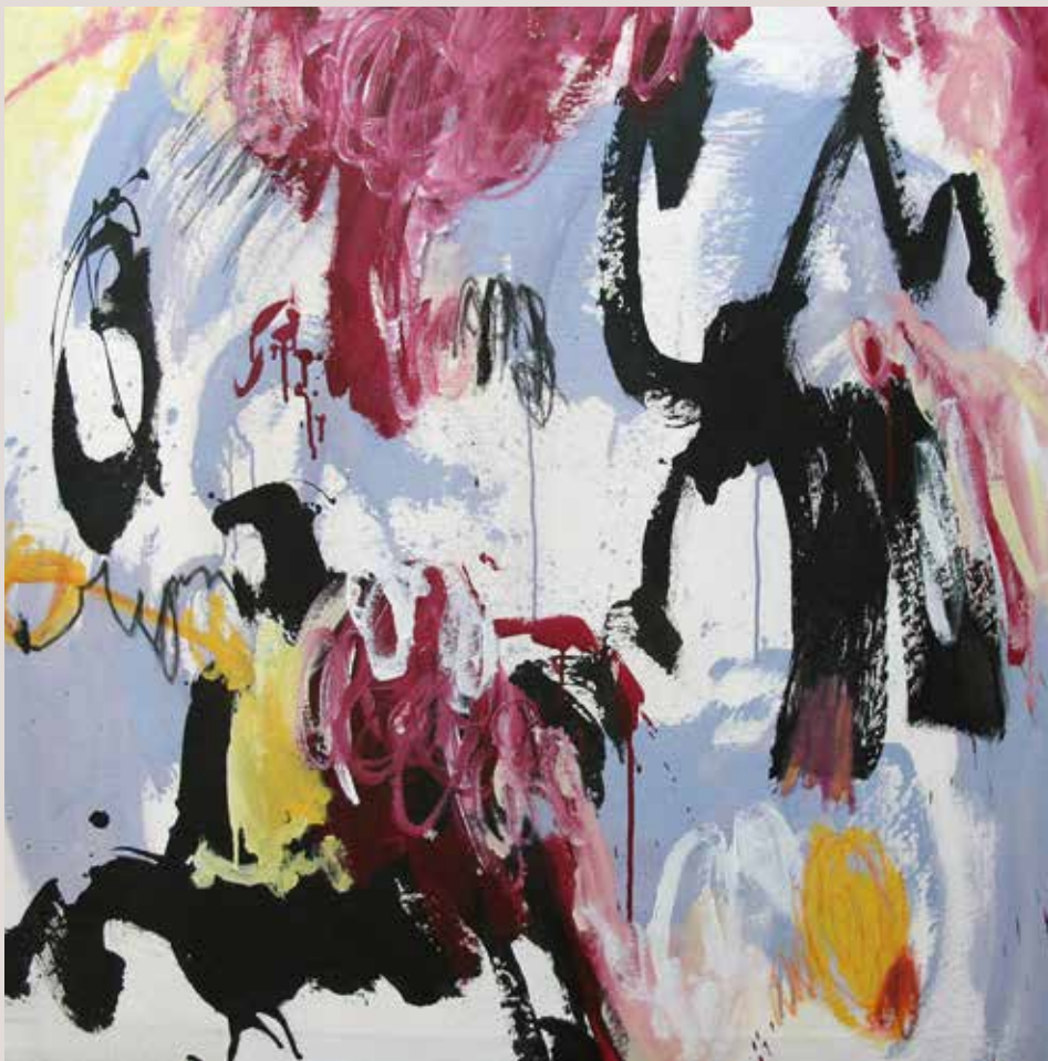
Dulce locura , 2014, Técnica mixta sobre tela. 100 x 100 cm