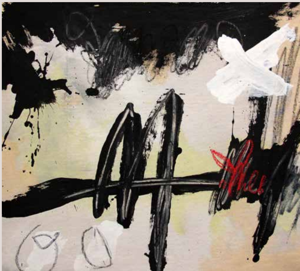
Ausente del mundo , 2014, Técnica mixta sobre tela. 41 x 46 cm