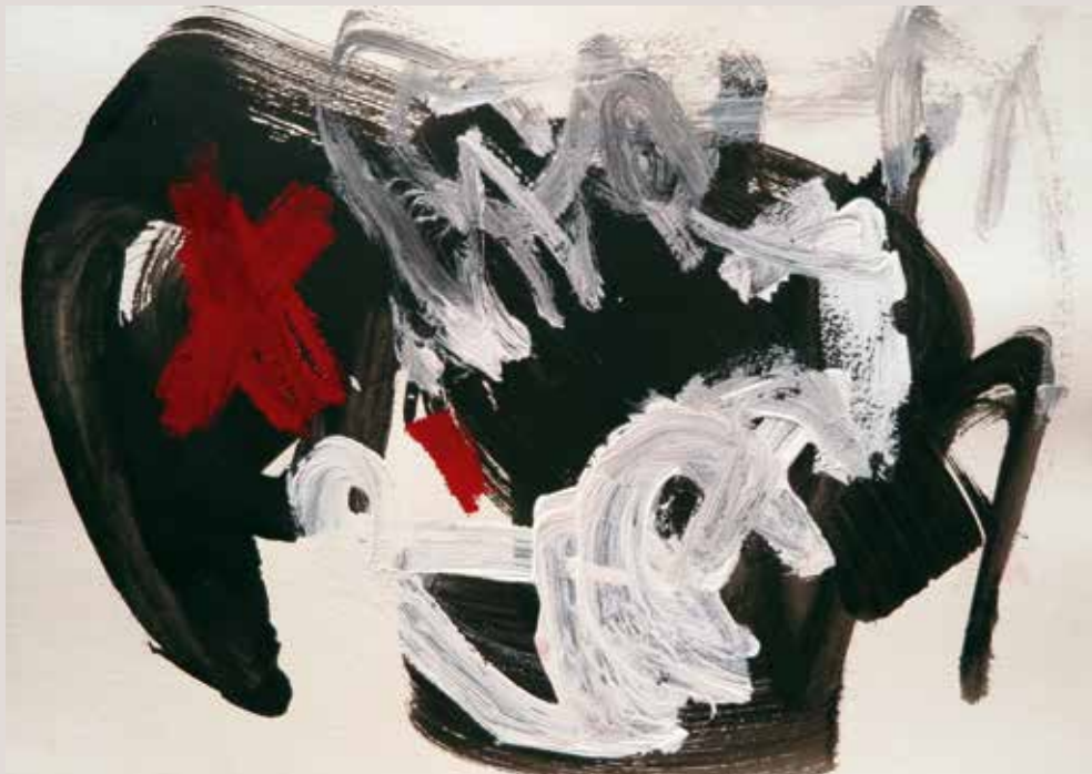
Oblidant el passat , 2014, T cnica mixta sobre paper. 30 x 40 cm