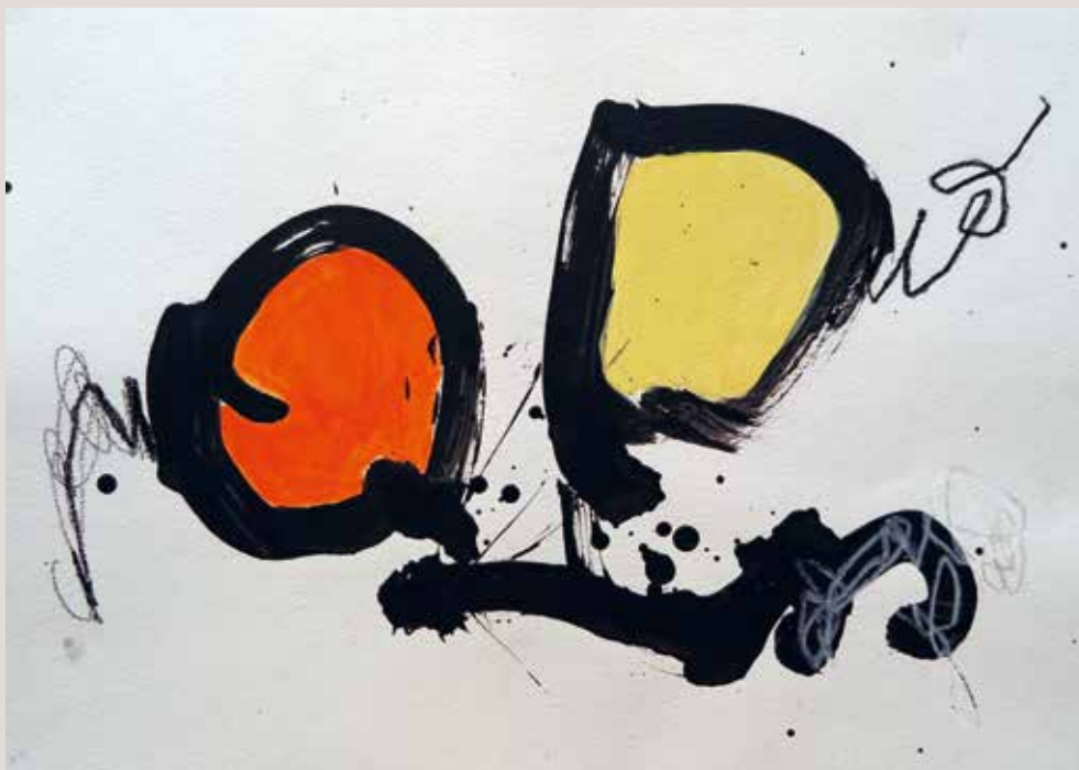
Deux routes , 2014, T cnica mixta sobre papel. 30 x 40 cm