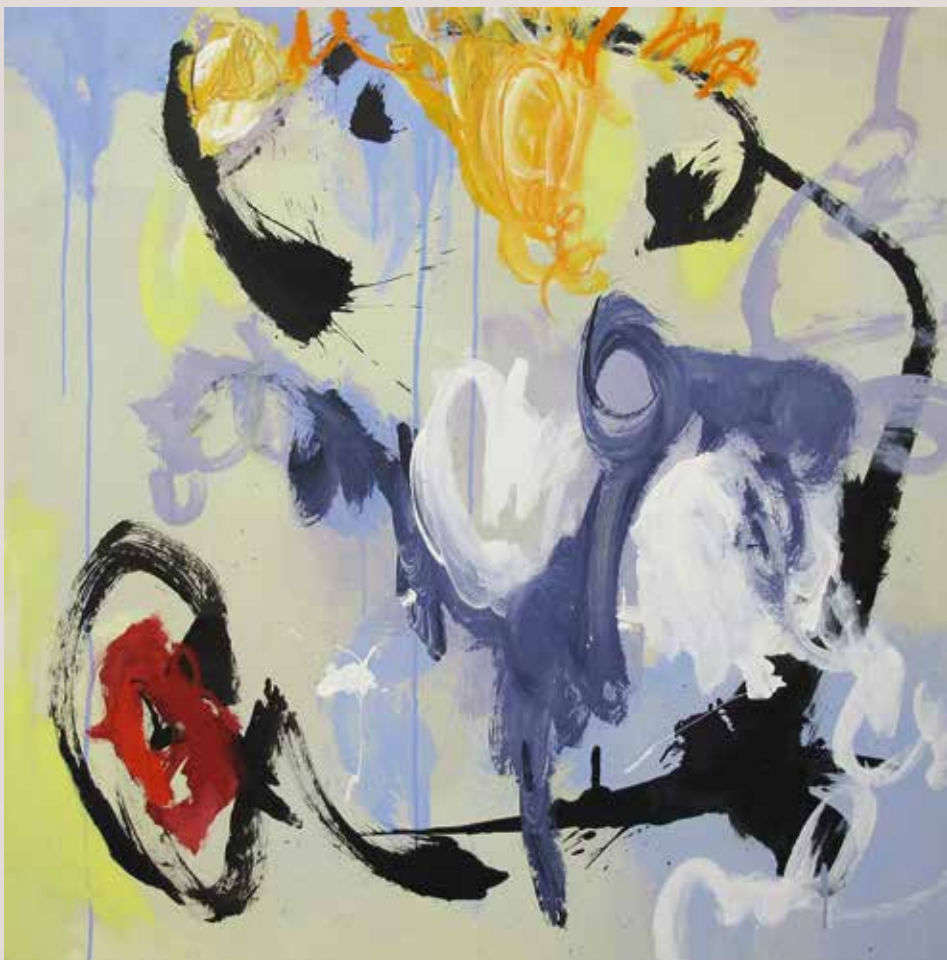
Saxo de fondo , 2014, T cnica mixta sobre tela. 100 x 100 cm