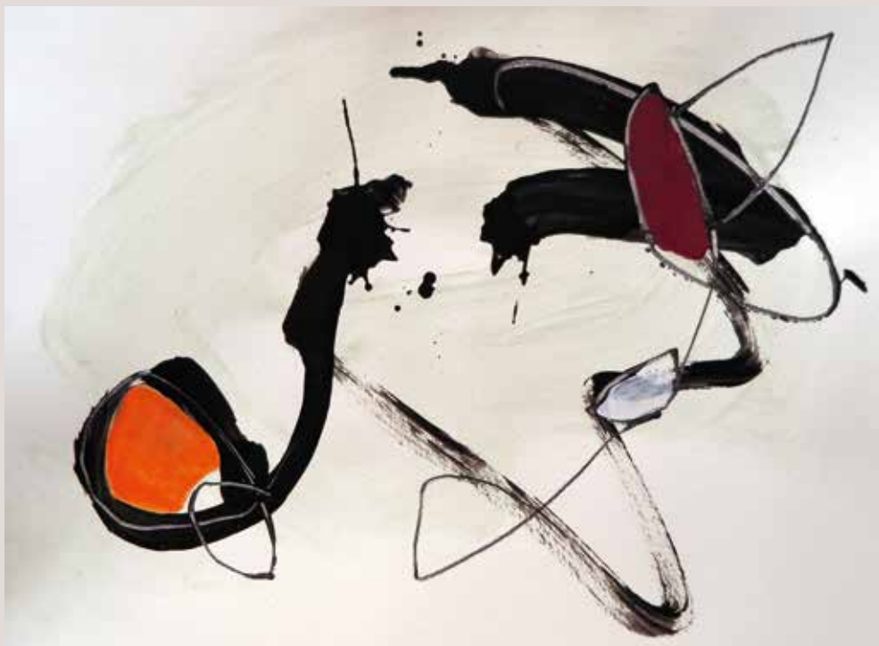
Intercanvi de records , 2014, T cnica mixta sobre paper. 30 x 40 cm