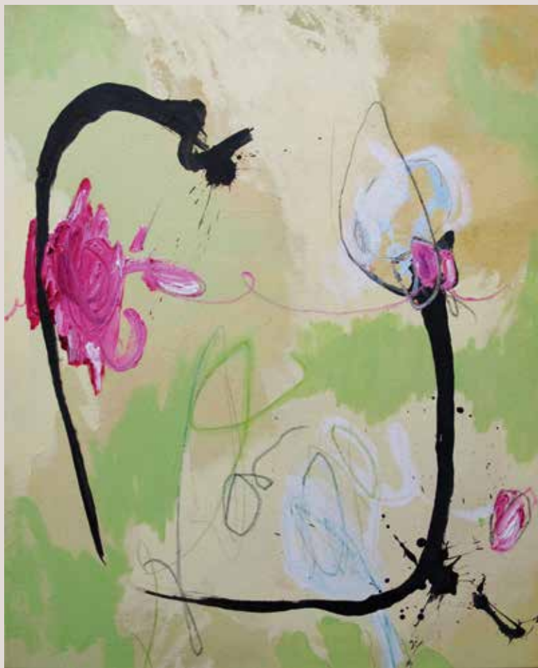
Flores en el sendero , 2015, Mixta sobre tela. 100 x 81 cm