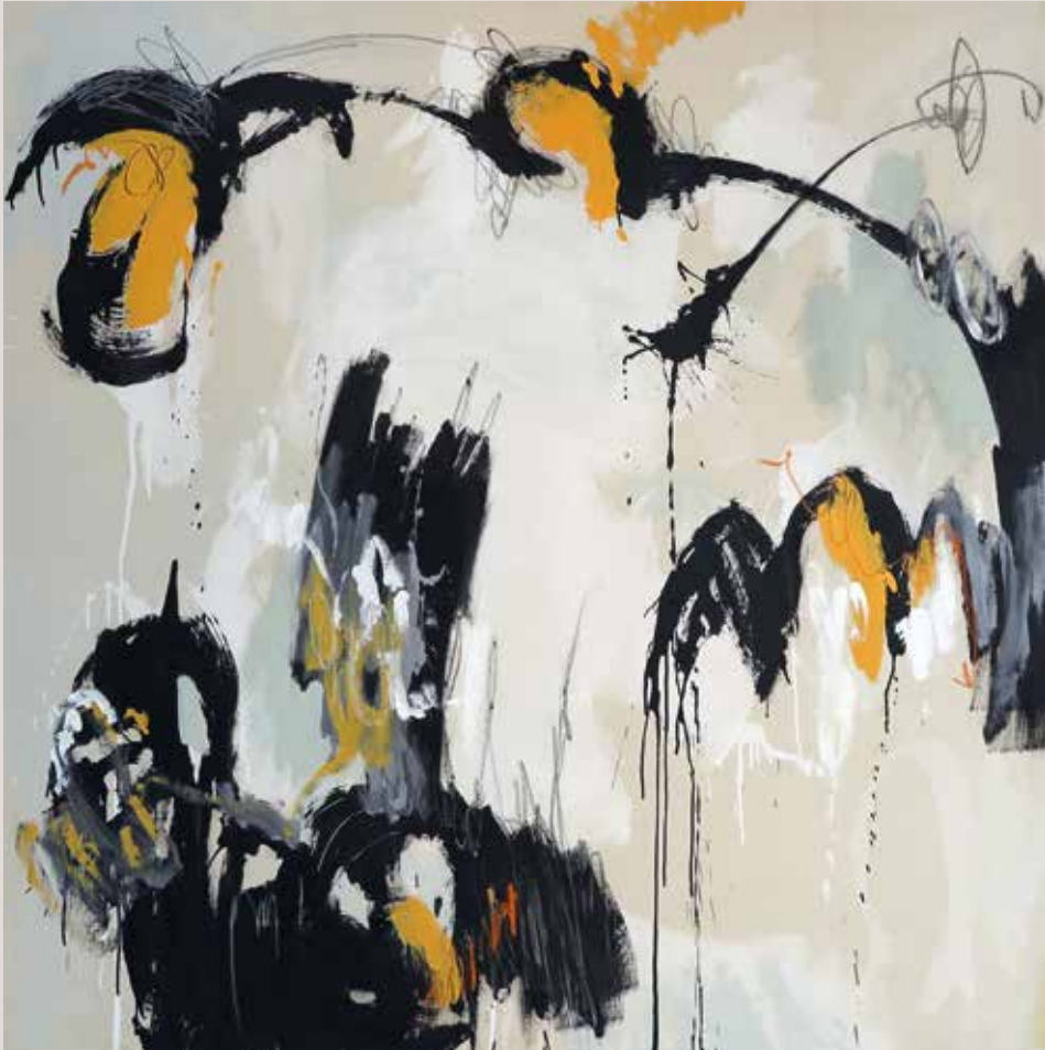
Buscando el equilibrio , 2014, Técnica mixta sobre tela. 150 x 150 cm