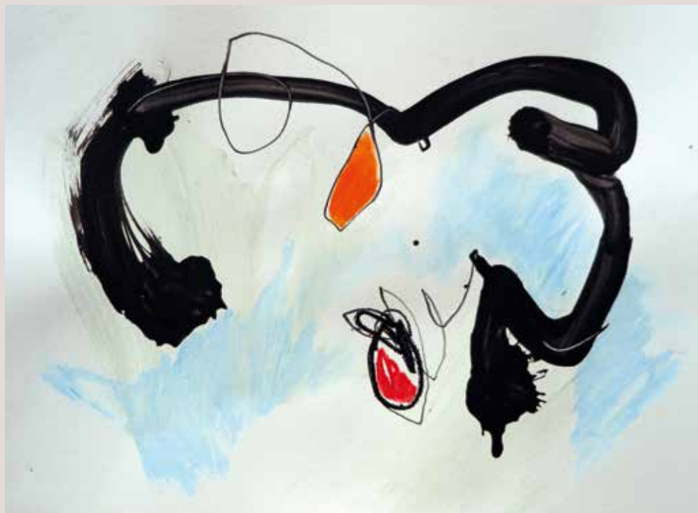
Una altra visió , 2014, Tècnica mixta sobre paper. 30 x 40 cm