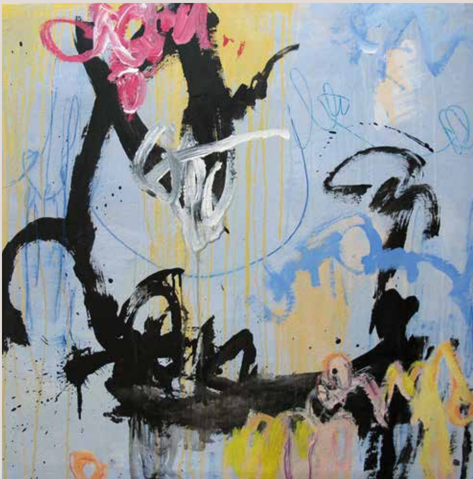
Breathing with D. in Centre Pompidou , 2014, T cnica mixta sobre tela. 100 x 100 cm