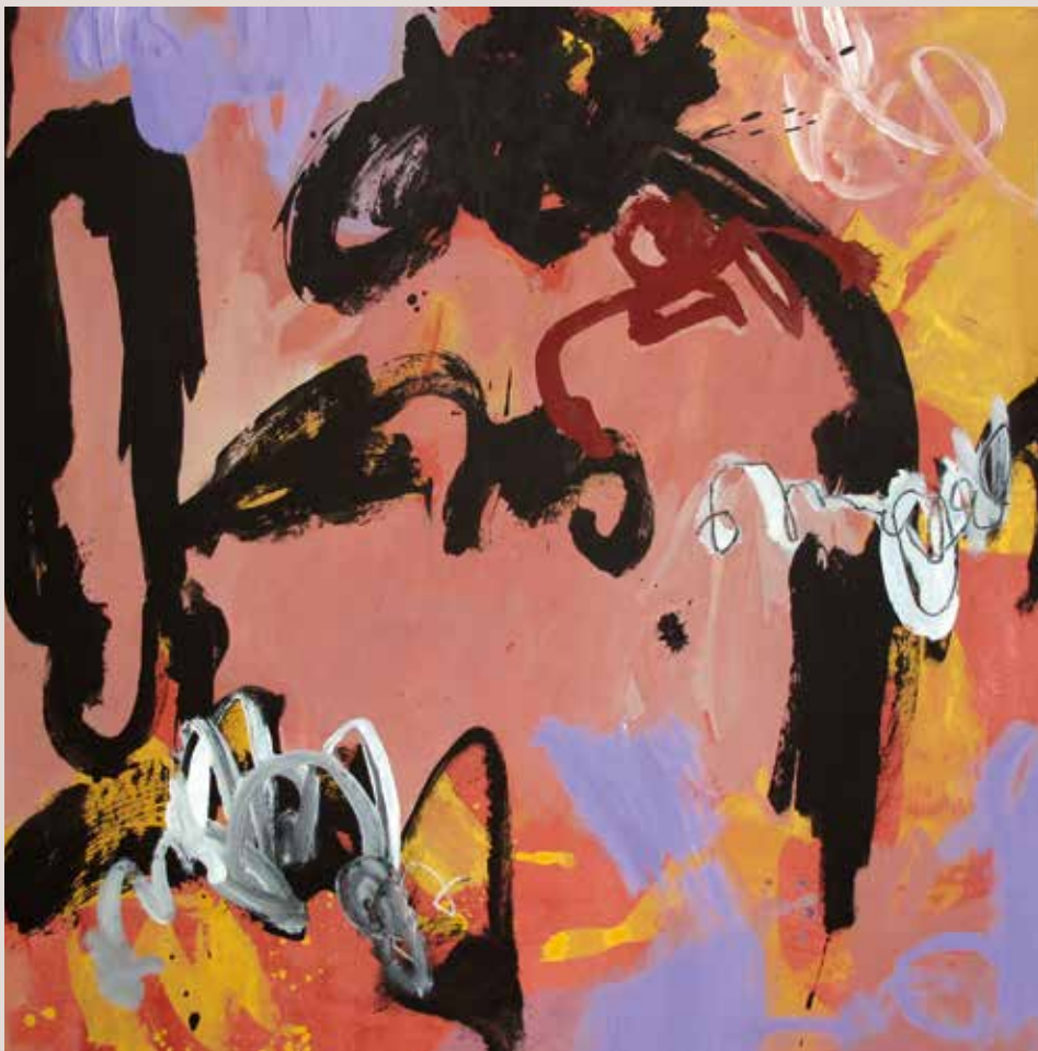
Place de la République , 2014, Técnica mixta sobre tela. 100 x 100 cm