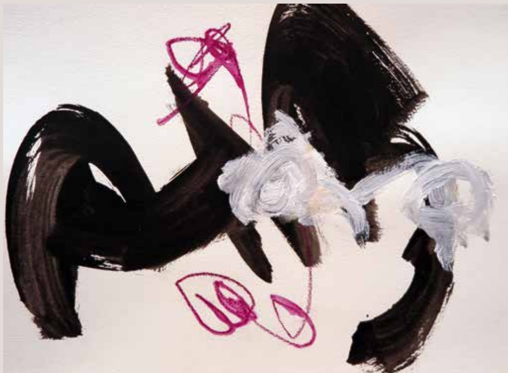
L'espoir , 2014, Técnica mixta sobre papel. 30 x 40 cm