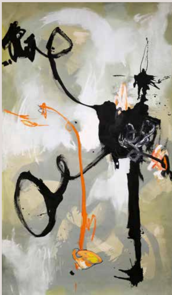
Escoltant els arbres , 2015, Mixta sobre tela. 226 x 132 cm