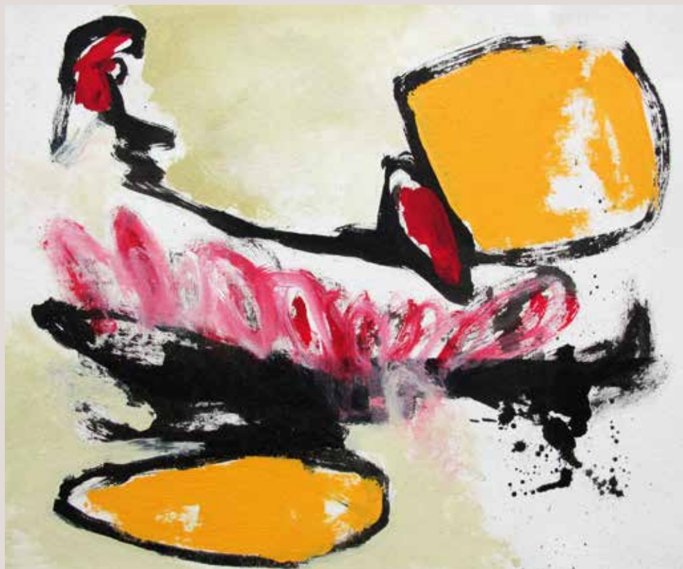
Place Concorde , 2014, Técnica mixta sobre tela. 38 x 46 cm