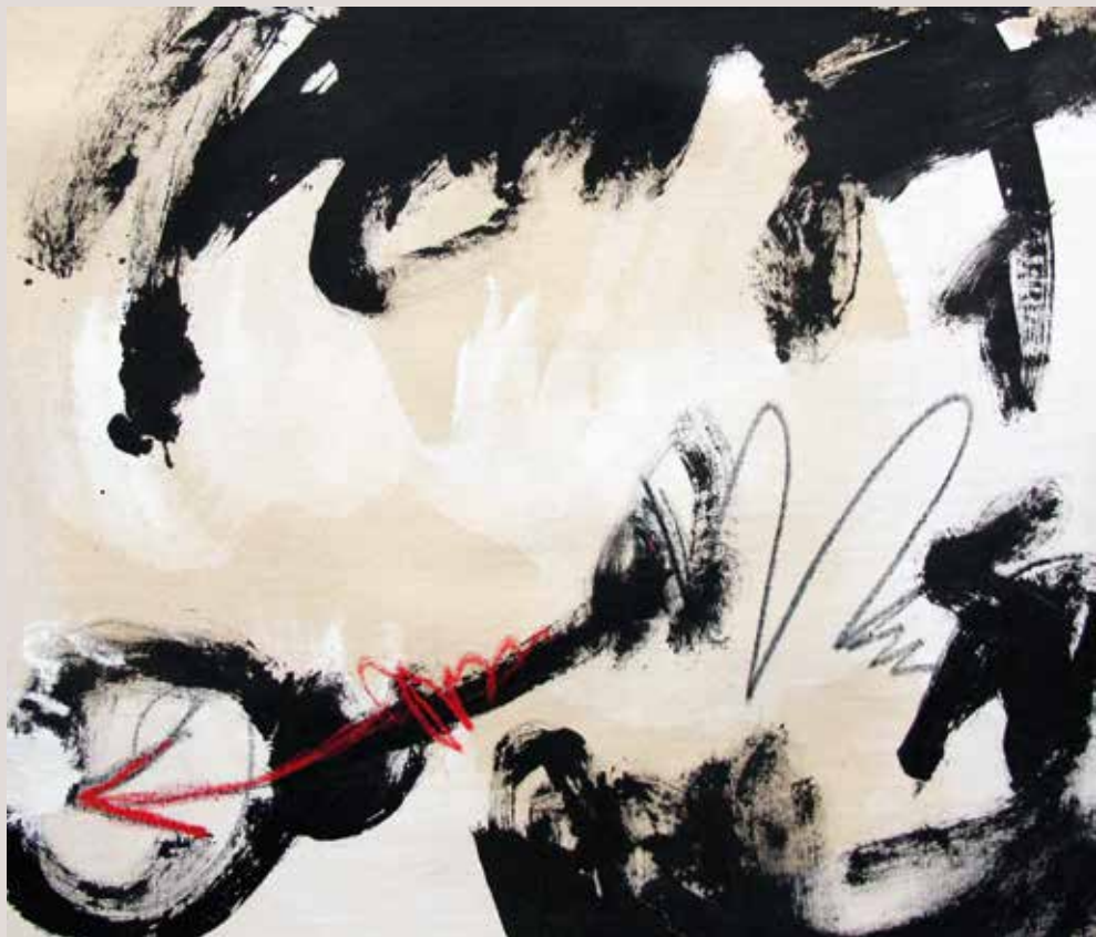
Tiempo perdido , 2014, Técnica mixta sobre tela. 38 x 46 cm