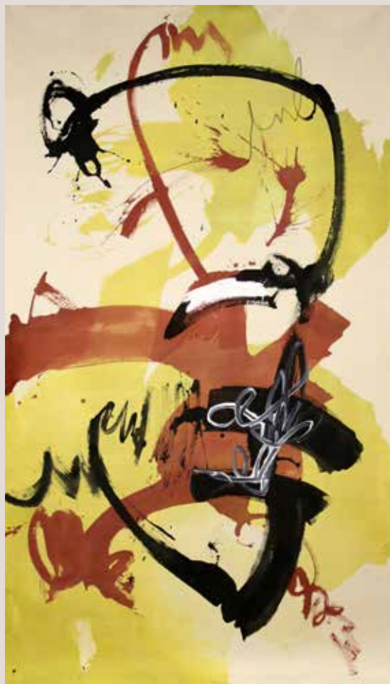
Un dia de tardor , 2015, Mixta sobre tela. 226 x 132 cm