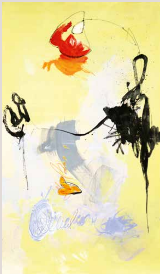
Pintant el cel , 2015, Mixta sobre tela. 226 x 132 cm