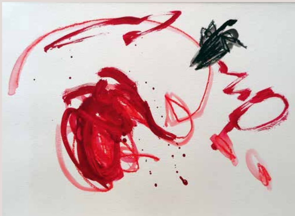
Jugant a imaginar , 2014, Técnica mixta sobre papel. 30 x 40 cm