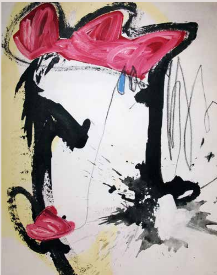
Sonido interior , 2015, Mixta sobre tela. 100 x 81 cm