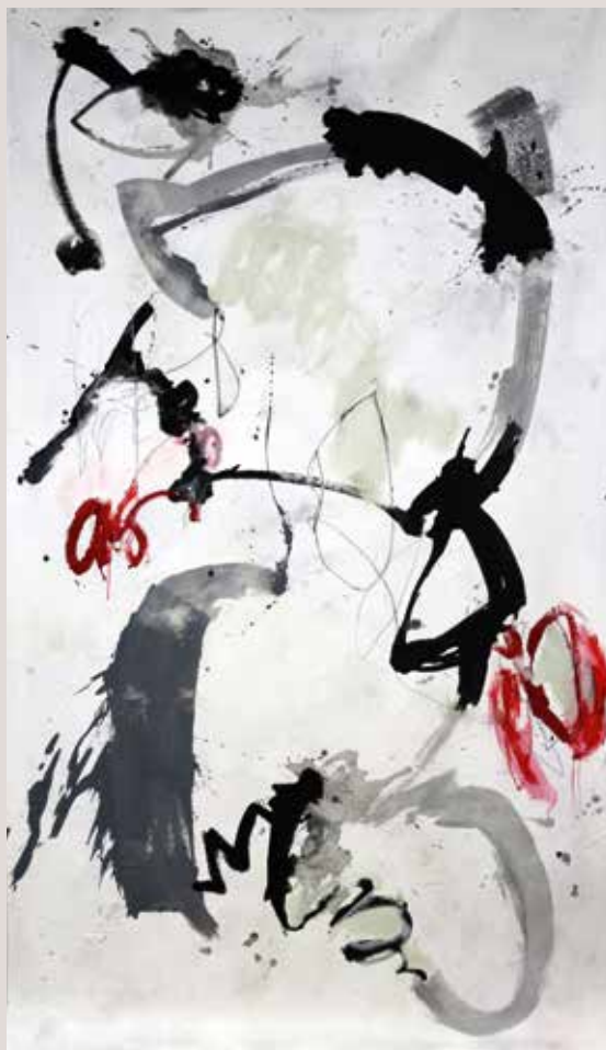
Reescrivint , 2015, Mixta sobre tela. 226 x 132 cm